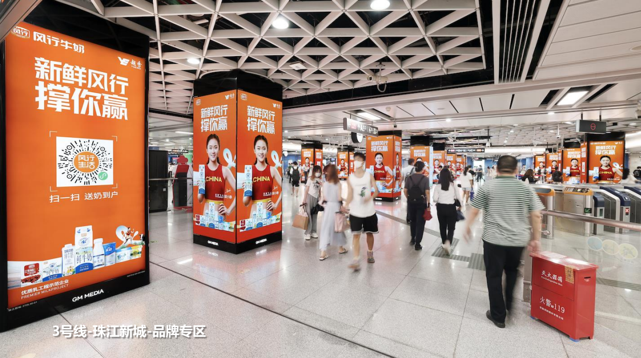
3号线-珠江新城-品牌专区