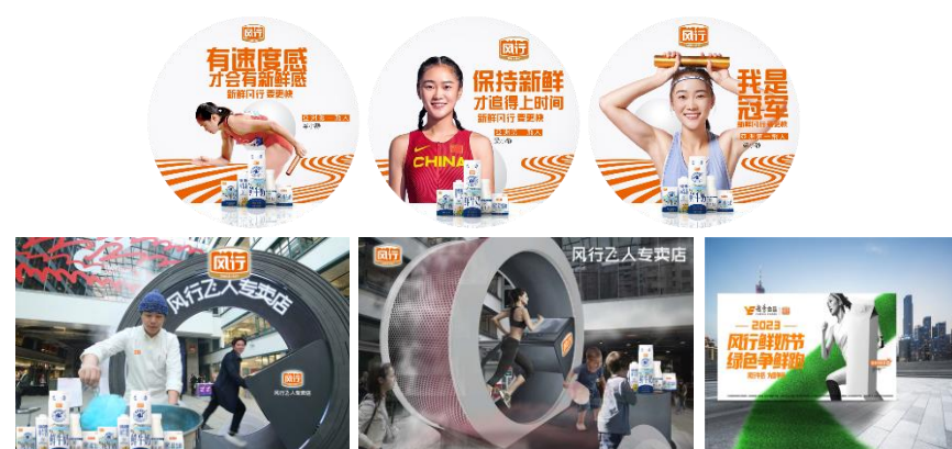
风行飞人跑步机线下互动体验