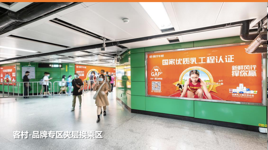
客村-品牌专区夹层换乘区

覆盖广州城100余个公交站点及CBD沿线，在珠江新城、体育西路、区庄等核心地铁站以及全市地铁站厅