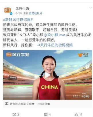
媒体告知，正式官宣