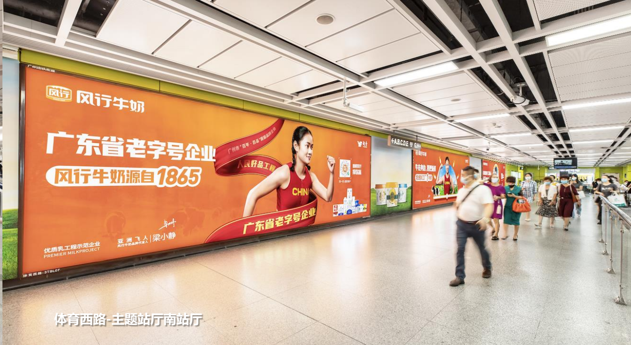
体育西路-主题站厅南站厅