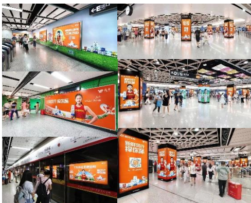
「送奶到户」渠道助推导流