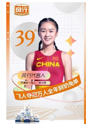
飞人夺冠鲜奶免单