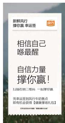
风行家庭健康跑【撑你赢幸运签】互动+风行健康赛道