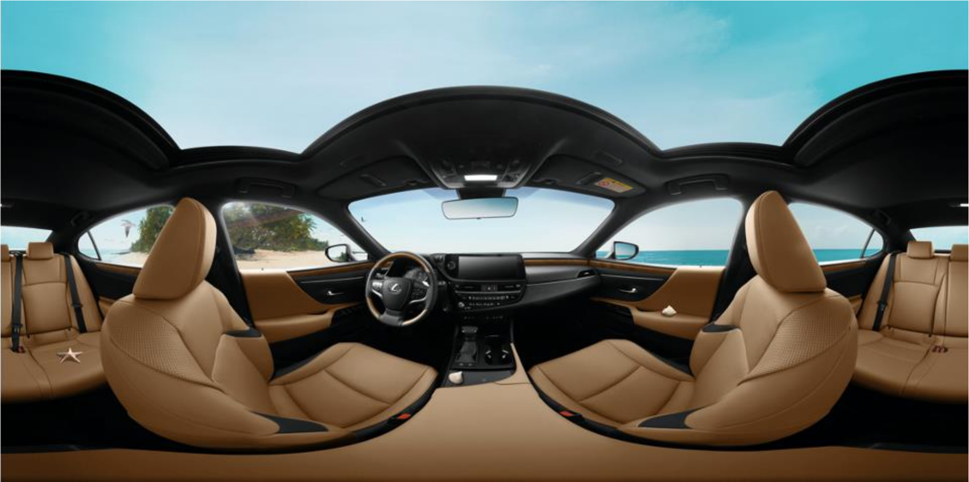
720度全景渲染效果图