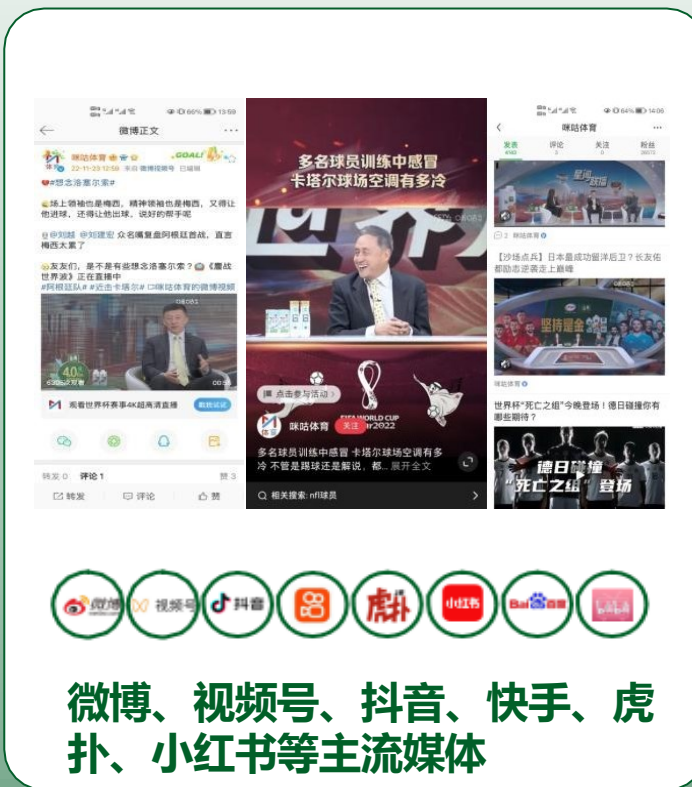
微博、视频号、抖音、快手、虎扑、小红书等主流媒体