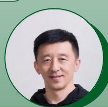
知名足球解说 刘越

绑定节目嘉宾进行深度互动，将产品及品牌精神融入节目内容，围绕品牌签约球队/球员及热点话题，打造专属互动环节，嘉宾深度互动诠释“坚持是金”的品牌精神