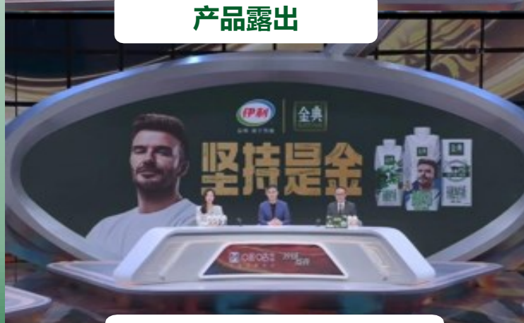
LED大屏绑定赛事预测