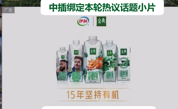
赞助标版绑定锦集回顾