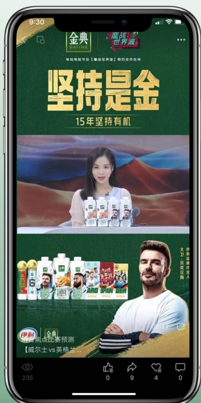
正片结束后-热门卡断授权