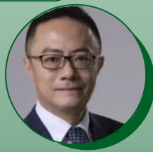
知名足球解说 魏翊东