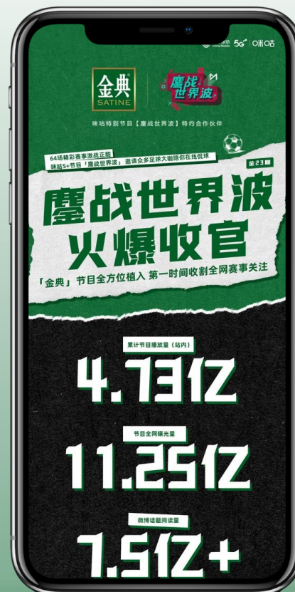
绑定节目节点产出节目数据长图