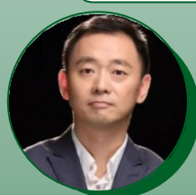
知名足球解说 颜强